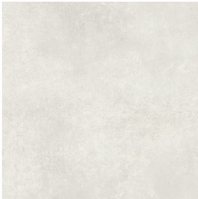
Rivestimento gres porcellanato formato 60x60 cm Marca Energieker, serie Select o simile Colore a discrezione del promotore