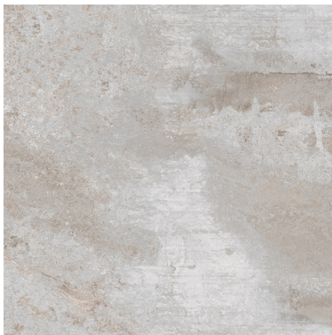
Pavimento galleggiante su piedini per terrazze e logge in gres porcellanato, formato 60x60 cm, Marca Energieker, serie Flatiron o simile Colore white a discrezione del promotore