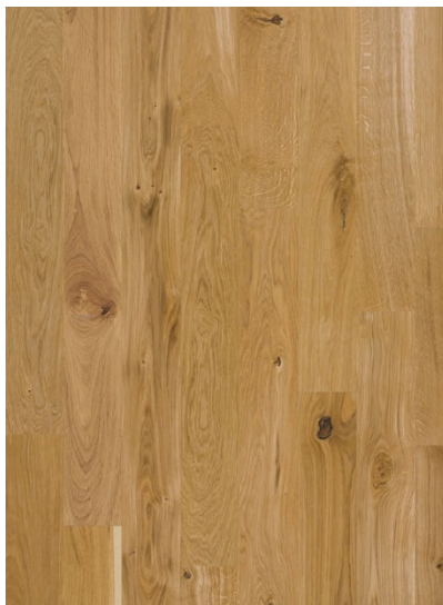
Parquet, formato 13 x 220 cm Marca Wicanders, serie European Castle Collection Habsburg